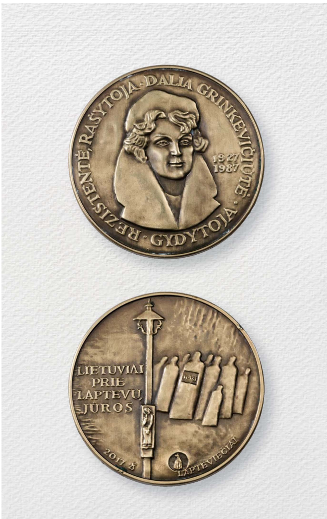
Dalios Grinkevičiūtės atminties ir pagarbos medalis, skiriamas už tiesos liudijimą, tremčių ir laisvės kovų istorijos skleidimą Lietuvoje ir pasaulyje

Aš kartoju sau: laikykis. Laikykis iš paskutiniųjų. Nepasiduok nevilčiai, sukauptk visas savo dvasios jėgas. Jie stengiasi suardyti tavo dvasinę pusiausvyrą ir nieko taip netrokšta – kaip pamatyti tave palaužtą, sugniuždytą, arba nusižeminusią ir vergiškai paklusnią.